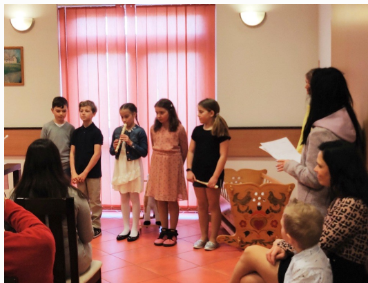
Vystoupení ZŠ při vítání tisoovských občánků.

Všem přejeme krásné prožití svátků jara, veselé Velikonoce!