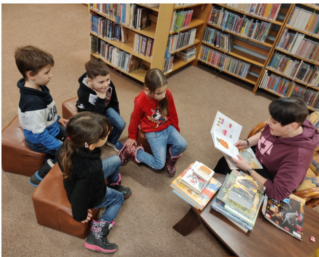
Návštěva vysokomýtské knihovny.

telně k této části roku, a tak jsme i my ve škole uspořádali karneval. Nechyběly velmi nápadité masky. Užili jsme si tu správnou karnevalovou náladu. Děti měly připraveno velké množství her, podpořených taneční hudbou, sladkými odměnami nebo balónky.