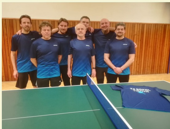
Nahoře: Trénink žákovské kategorie, tzv. přípravy, a sestava stolních tenistů TJ Sokol Tisová.