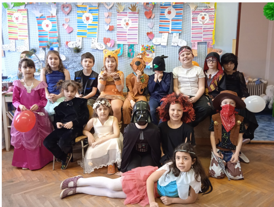
Karnevalový den v ZŠ Tisová.

Navštívili nás i z cirkusu. Využili jsme možnost podívat se na „Show se zvířátky“, pobavit se kouzly kouzelníka, žasnout nad mrštností pejsků, zasmát se vtipům a pohladit si opičku Žofinku.