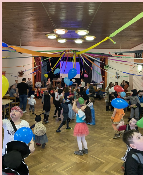
Dětský maškarní karneval.

Připravené soutěžení pro děti i maškarní rej s následnou tombolou bylo příjemným zpestřením nedělního odpoledne. Děkují všem za účast na