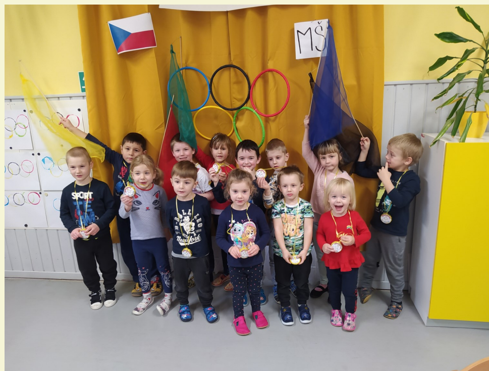
Velká zimní olympiáda, vítězná sestava dětí MŠ.