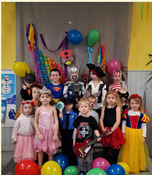
Masopustní karneval dětí MŠ.

Nesmíme opomenout zmínit návštěvu cirkusu ve škole, kde jsme samozřejmě nemohli chybět. Představil se nám zde kouzelník a kouzelnice, kte-