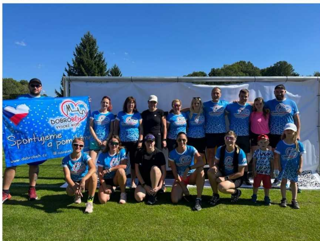
Charitativní běh v Českých Heřmanicích na 8 a 3,5 km.

Na neděli 22. října 2023 připravují Dobroběžci svou vlastní tradiční charitativní akci Podzimní Dobroběh . Bude se konat opět na Vinicích a chceme tímto pozvat nejen běžce, ale i neběžce, kteří mohou akci podpořit procházkou po kratší trase v lese na Vinicích u rybníku Chobot. Výtěžek Podzimního Dobroběhu bude použit pro dvouletou Ditušku z Vysokého Mýta na nákup rehabilitačních pomůcek na rozvoj motoriky.