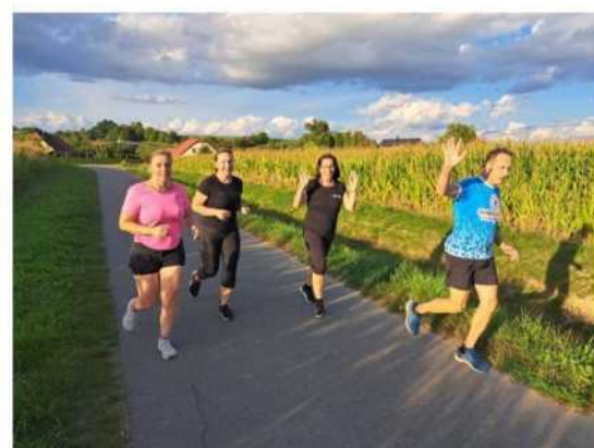
Foto vlevo: Charitativní běh v Luži na 9 km, startovalo se od hradu Košumberk. Zástupci z Tisové opět nechyběli.