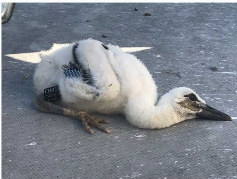
Okroužkované mládě čápa v Tisové.

Stalo se tak 30. 4. 2023 kdy nad školou kroužili rovnou tři jedinci. Dva sedli a rozhodli se v dalších dnech začít stavět hnízdo, nedávala jsem