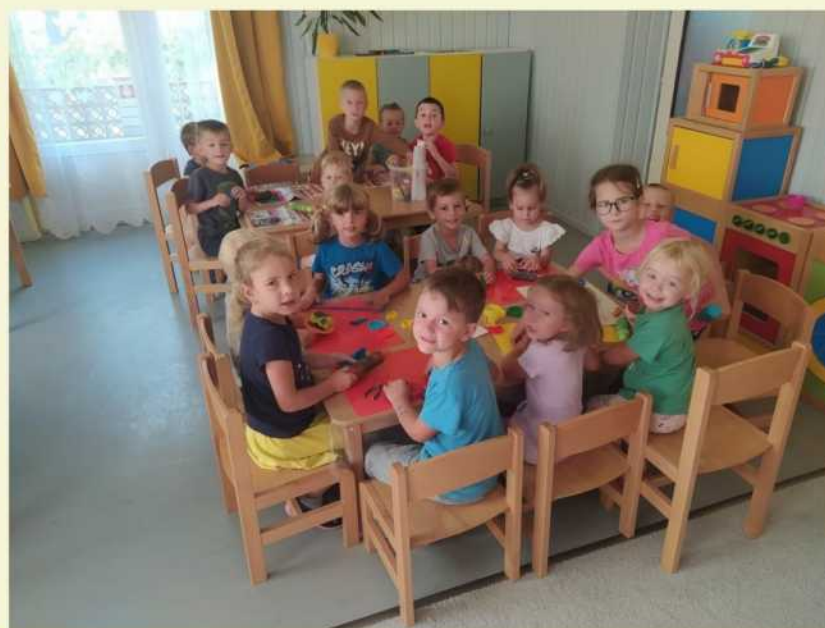
Pracovní činnosti dětí v MŠ.