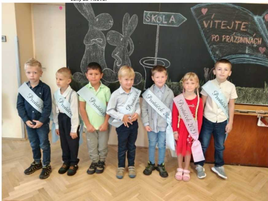
Přivítání našich prvníčků.

Nám všem, žákům, učitelům i rodičům, přejeme klidný školní rok plný